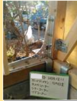
耐震金物でしっかり補強しました！