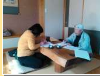
弊社の建替えとリフォームで悩んでいる方のための相談会にご夫婦でご参加。現在の状況やお悩みを書き出して、どんな工事が一番いい方法かじっくり検討しました。