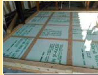
床の底冷えは断熱材でシャットアウト！