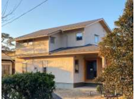
完成目前です!!見学会をお楽しみに!!